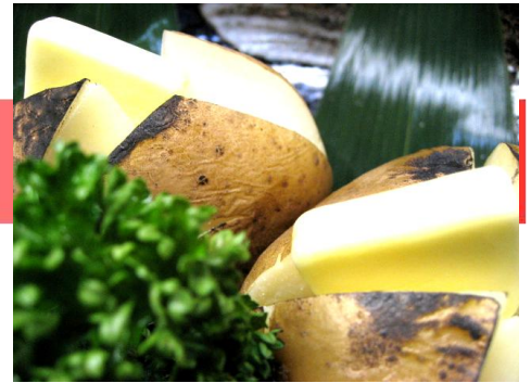
ホクホク じゃがバター焼き