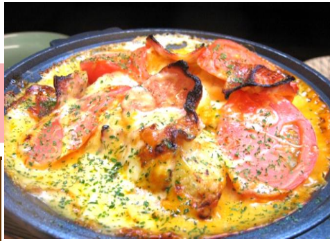
じゃがいもとトマト のチーズ焼き