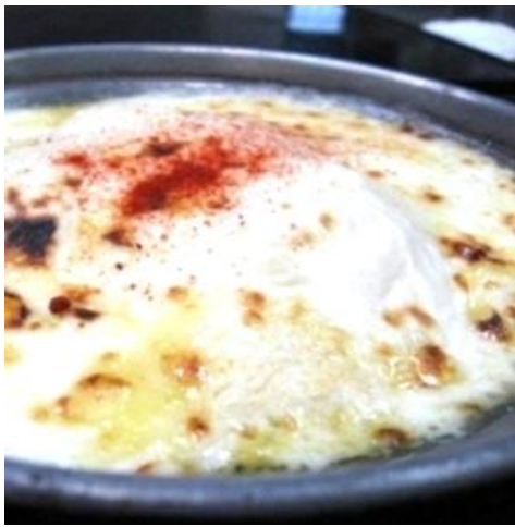
クリーミー豆腐 チーズ焼き