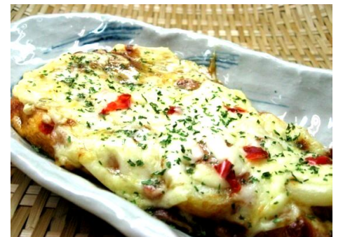
ナンピザ(カレー味)