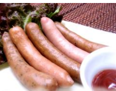
ウィンナー盛り合わせ