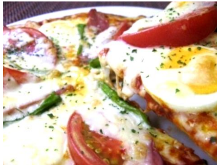
こだわりミックスピザ